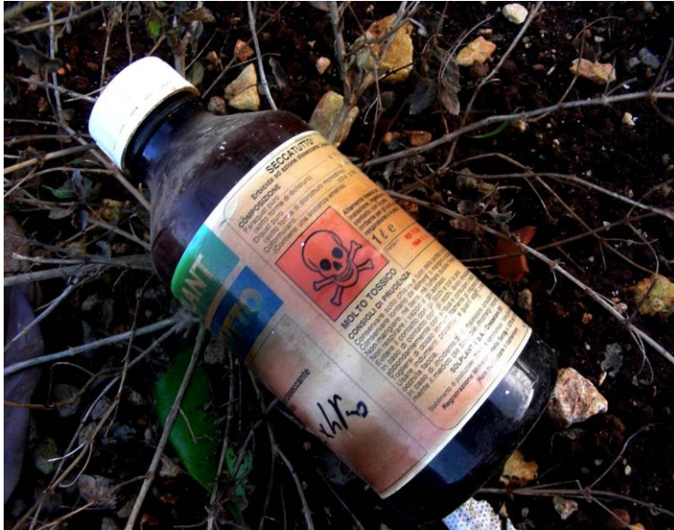
Molti dei diserbanti utilizzati presentano elevato grado di tossicità