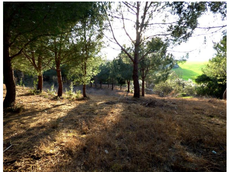
Diserbo effettuato in periodo di fioritura ed in aree naturali e seminaturali senza alcun cartello di avvertimento