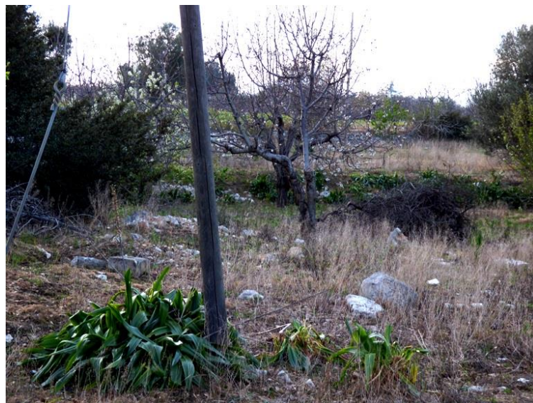
Frutteti diserbati in periodo di fioritura del substrato erbaceo o degli alberi da frutto

c/o Filippo D'Erasmus Via G. Postiglione n. 9 70126 - Bari museoderomita@gmail.com museoderomita@pec.it info@centrostudideromita.it