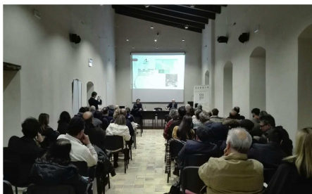
Conversano 15 marzo 2016