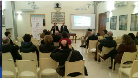
Noicattaro 9 marzo 2016