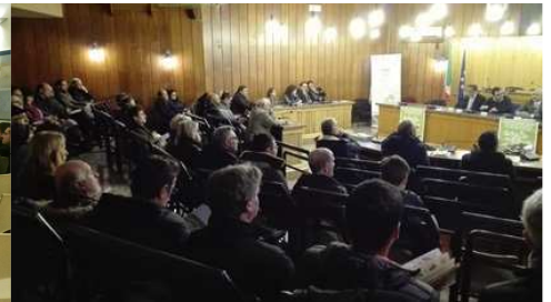
Rutigliano 11 marzo 2016