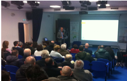
Casamassima 8 marzo 2016