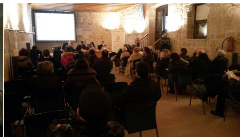
Mola di Bari 16 marzo 2016